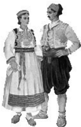
Dubrovnik – Konavle