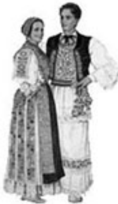
Slavonija – Vinkovci

Note: On peut remplacer les feuilles de chou par des feuilles de vigne.