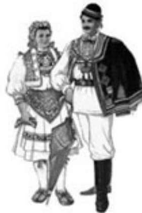
Zagreb – Sestine