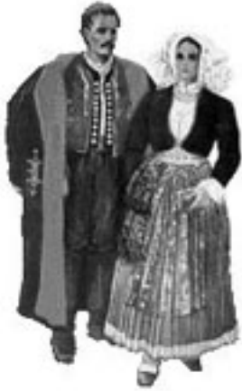
Island of Pag

L'ex-Yougoslavie est réputée dans le monde entier pour ses danses folkloriques, qui s'exécutent en groupes mixtes ou en groupes composés exclusivement d'hommes, de femmes ou d'enfants. Les danseurs se tiennent par la main, par la ceinture, par les épaules, ou à l'aide de foulards, de ficelles perlées ou de petites serviettes. Leurs mouvements sont rapides et vigoureux.