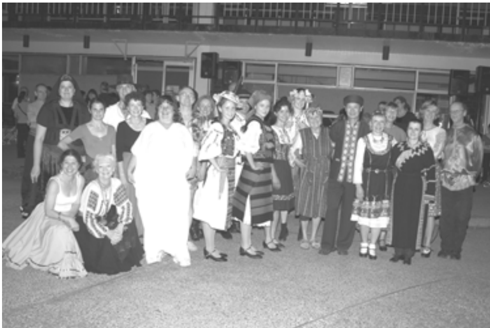
Jeudi le 26 août 2004

Avocat, facteur, médecin ou réceptionniste, la passion de la danse folklorique rapproche ses adeptes comme les membres d'une même famille. Le courant passe et tous vibrent à l'unisson. Les folkloristes du jeudi voyagent de par le monde, en 3 heures, et ce pour moins de $ 5.00. Pas besoin "d'extasy" pour s'éclater : les sons et les rythmes suffisent à procurer un maximum de sensations de par leur variété et leur intensité. Et les défis ne manquent pas. Lequel d'entre-nous n'a pas éprouvé cette fantastique joie de maîtriser (enfin!) ce m.....pas, sur lequel on bâchait depuis des semaines et qui nous arrachait des jurons à faire rougir un débardeur?