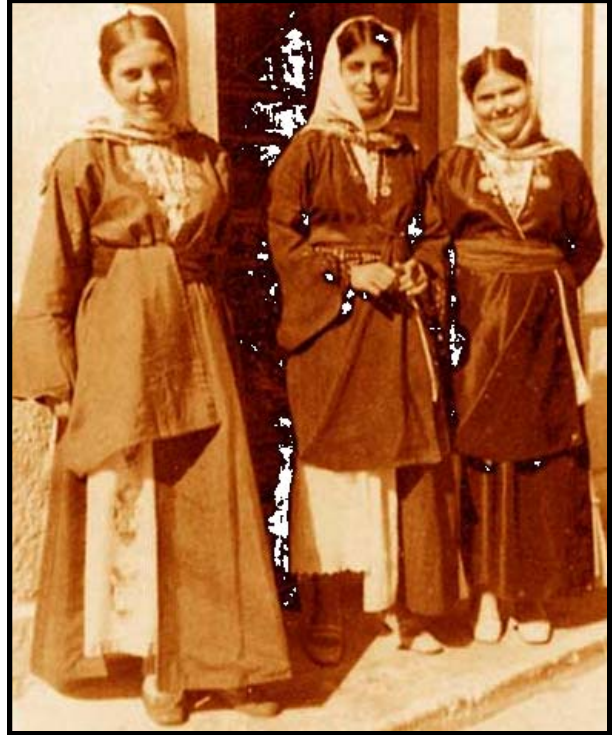
Costume de Kalimos →