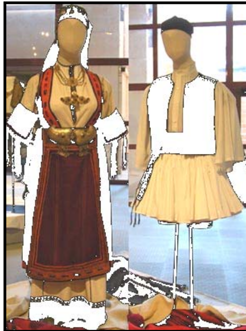
← Costumes de Thessalie