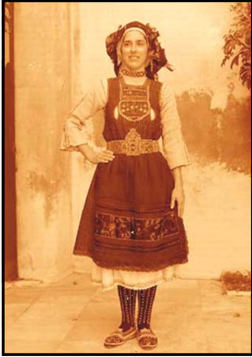
← Costume de METAXADES